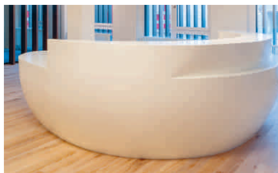
Die Theke im «Rohbau» (oben) und fertiggestellt in der Bank.

Eine grosse Anzahl unserer Mitarbeiter war nötig, um das 750 Kilogramm schwere Teil «in Empfang» zu nehmen, an den geplanten Ort zu tragen und zu platzieren.