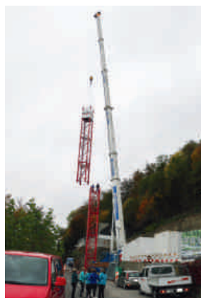
Die Montage des Hächler-Krans.

Die Hächler AG Immobilien baut an der Schartenfelsstrasse in Wettingen Terrassenhäuser. Der Sonnenhang bietet einen atemberaubenden Blick über Baden bis ins Limmattal.