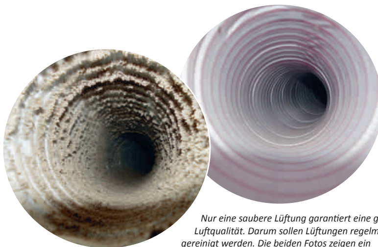
Nur eine saubere Lüftung garantiert eine gesunde Luftqualität. Darum sollen Lüftungen regelmässig gereinigt werden. Die beiden Fotos zeigen ein Lüftungsrohr vor der Reinigung (links) und danach.