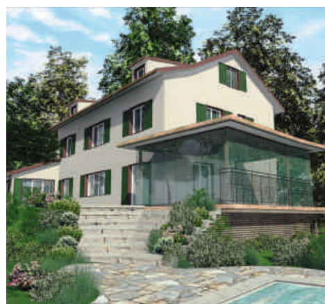
Beispiel einer Modernisierung eines Einfamilienhauses: links während dem Umbau, rechts danach.

In unmittelbarer Nähe findet dann auch die Messe Bauen+Wohnen statt. Nach Ihrem Besuch bei uns schenken wir Ihnen Eintritte, damit Sie sich dort weiter inspirieren können.