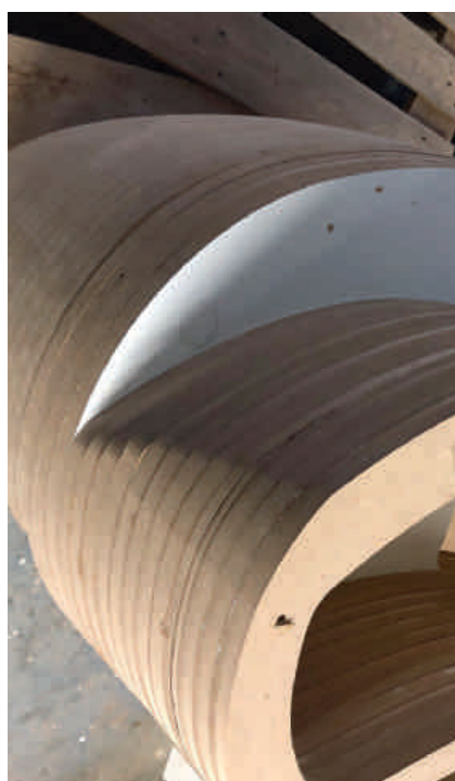
57 Holzschichten bilden die Basis der Theke.