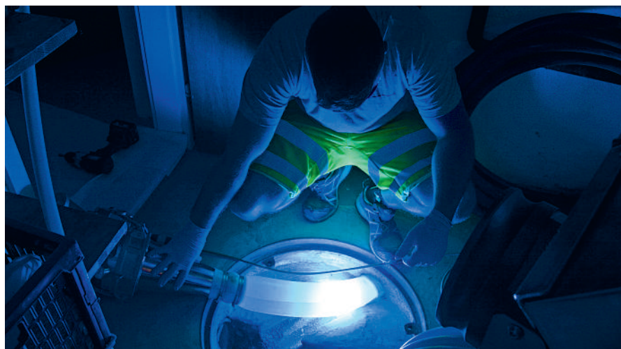
Dicht dank Licht: das Bluelight-System im Einsatz.