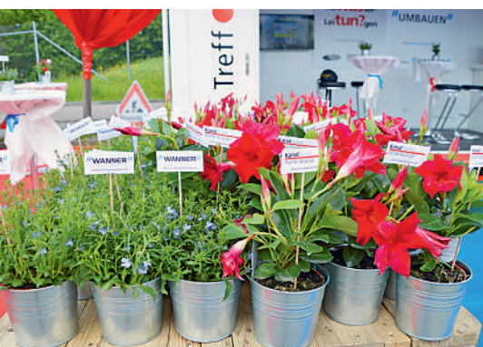
Unser Frühlingsgeschenk an der Messe.

Kundenarbeiten sowie Betonsanierung und betreibt Filialen in Regensdorf, Dielsdorf, Oberhasli und Zürich. Kanal total untersucht Leitungen und kann diese, ohne aufzugraben, sanieren. Zudem bietet Kanal total einen 24-Stunden-Notfallservice an.