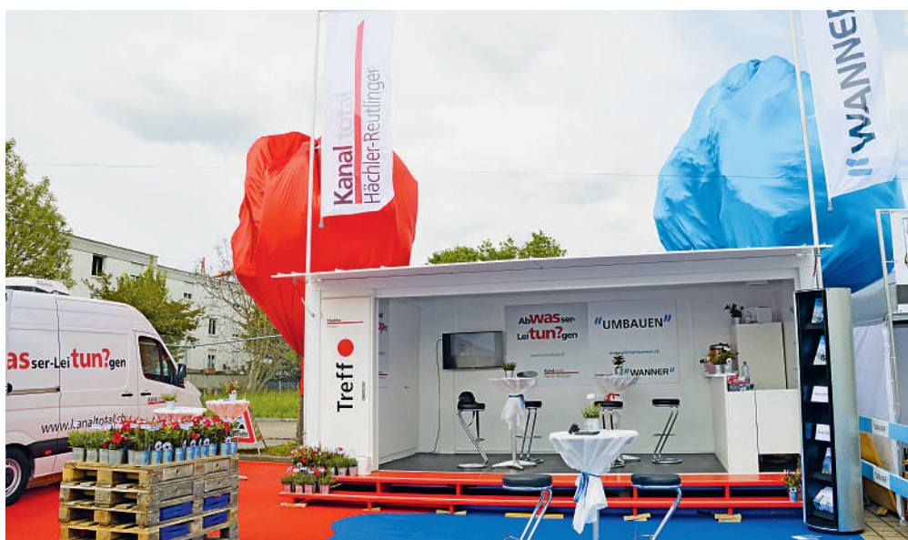
Die Farben Rot und Blau dominieren am Stand der Hächler-Reutlinger AG und Wanner AG.