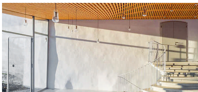
(oben) Das Foyer von aussen. (unten) Blick auf den Verputz der Aussenfassade.